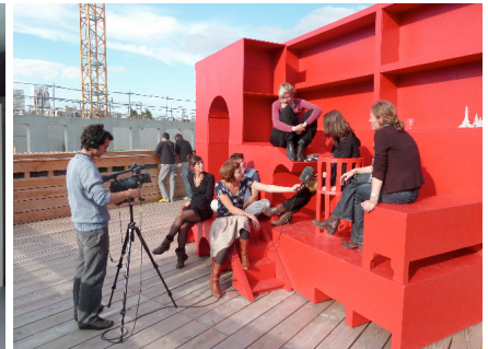
Atelier Trans 305 in Paris

Bereits umgesetzt haben sechs unserer Studierenden das Projekt „Sender Weimar“ im Rahmen des Kunstfestes Weimar 2010 und unter Leitung des Regisseurs und Dozenten Lukas Matthaer. In einer zwölfstündigen Performance mit acht Tänzern und vier Musikern untersuchten sie in einer großen Wanderung – einer choreographischen Feldmessung – gemeinsam mit den Besuchern unterschiedliche Areale der Nietzsche-Gedächtnishalle.