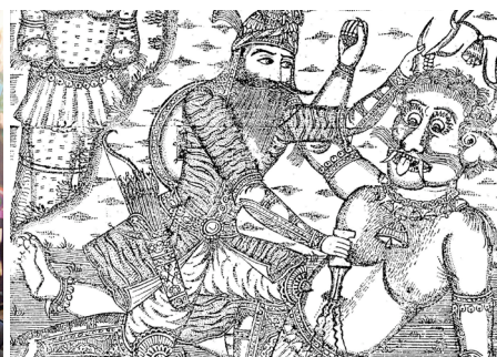
Shahname - Ausstellungsprojekt