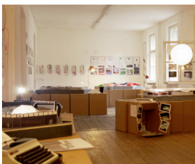
Meisterszenen - Ausstellung im Ballhaus Ost